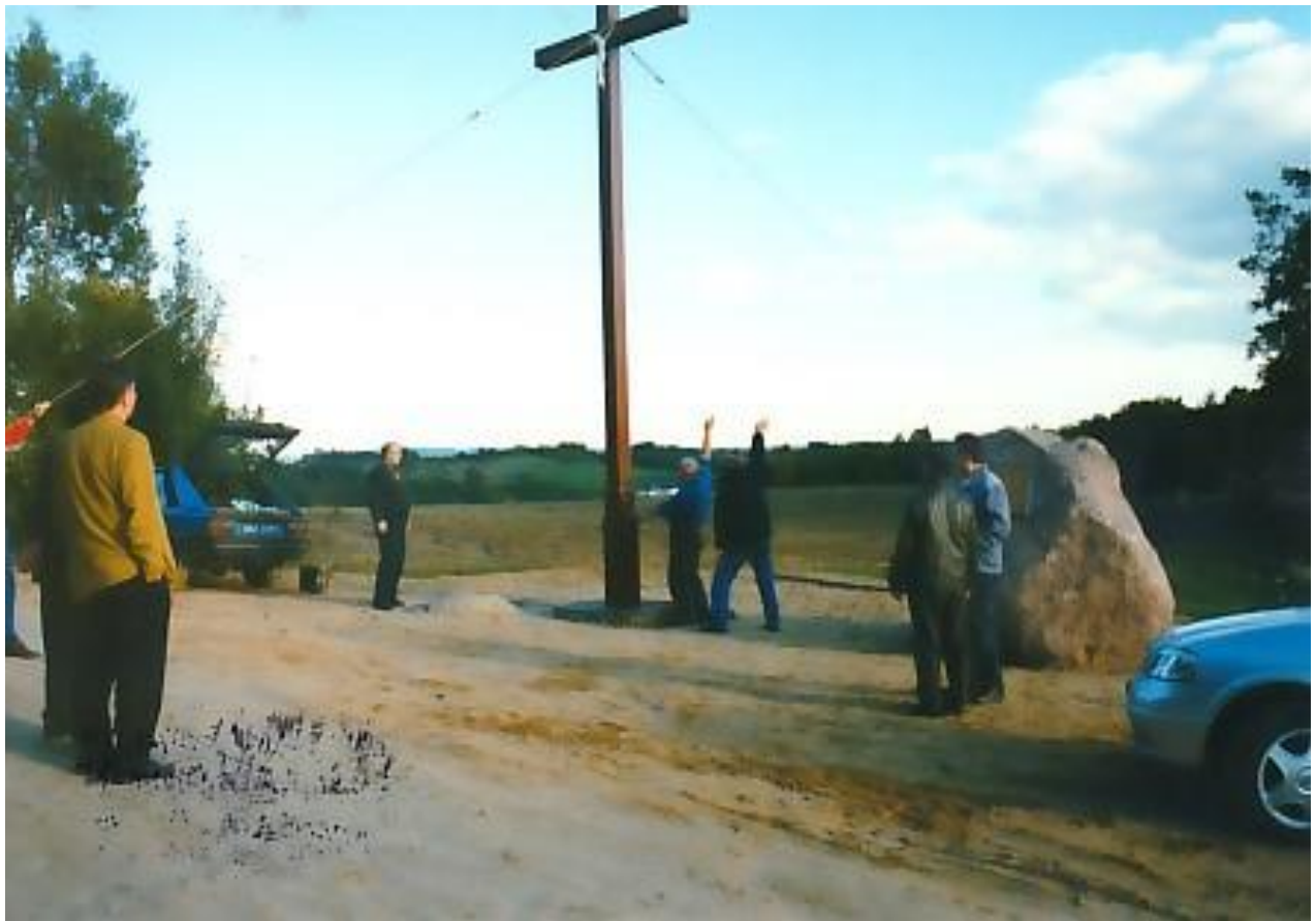
Uroczystość odstonięcia pomnika odbyła się w dniu 24.09.2000r.